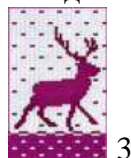
1 Геометрический 2 Животный 3 Растительный